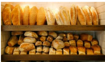
• La meilleure boulangerie saison 2 : Episode 2 Midi Pyrénées

La selection de la redac Exclu Découvertes Reportages Interviews Toute l'actu