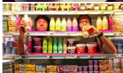
Michel et Augustin : Leur yaourt grec débarque en France