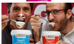
Michel et Augustin