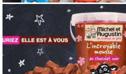
Michel et Augustin : Distribution de mousse gratuite à Lyon