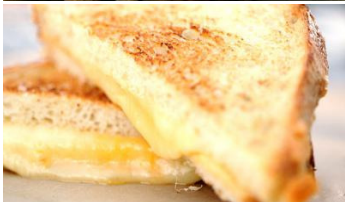
• Des sandwiches au fromage livrés par parachute