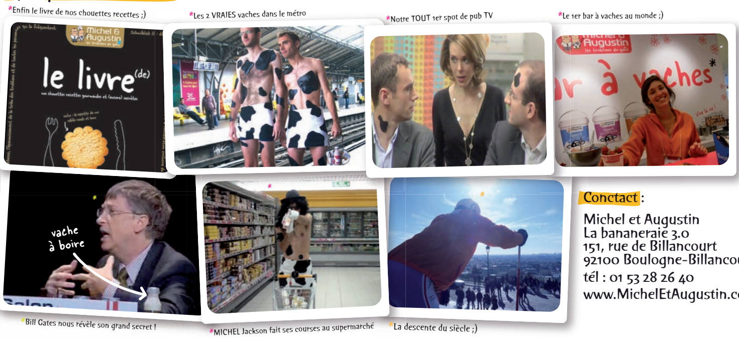
*Enfin le livre de nos chouettes recettes ;)