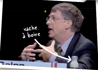
*Bill Gates nous révèle son grand secret !